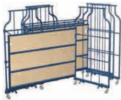
Corletta® w stanie złożonym