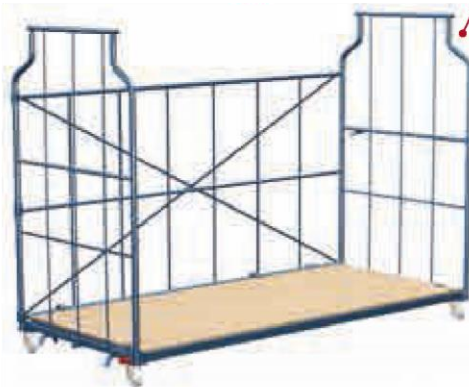
Corletta® standardowa 2500

Takie oznaczenie Corletty® mówi o tym, że puste bez towaru mogą być wsuwane jedna w drugą dzięki "trikowi ze składaniem". W ten sposób oszczędzacie Państwo miejsce na składowanie.